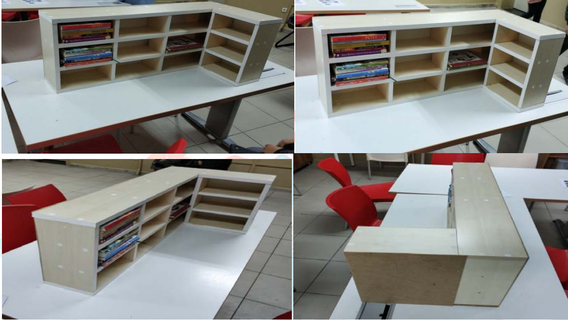
Şekil 3.2. Kitaplığın prototipi.

taşımadığı ve suntanın ince yapısından ötürü vidalama yapılamamıştır. Bu yüzden daha kalın bir malzeme kullanılması gerektiği anlaşılmıştır. Okulumuzda bu kalın malzemeyi kesebilecek uygun testere bulunmadığı için mahallemizde bulunan marangoza gidilmiş ve kesim-vidalama işlemleri güvenlik önlemleri alınarak burada birlikte yapılmıştır. Prototipin boyutları şu şekildedir; uzun kenarı 92 cm, kısa kenarı 40 cm, yüksekliği 38 cm ve derinliği 15 cm'dir. Şekil 3.2'de kitaplığın prototipi gösterilmiştir.