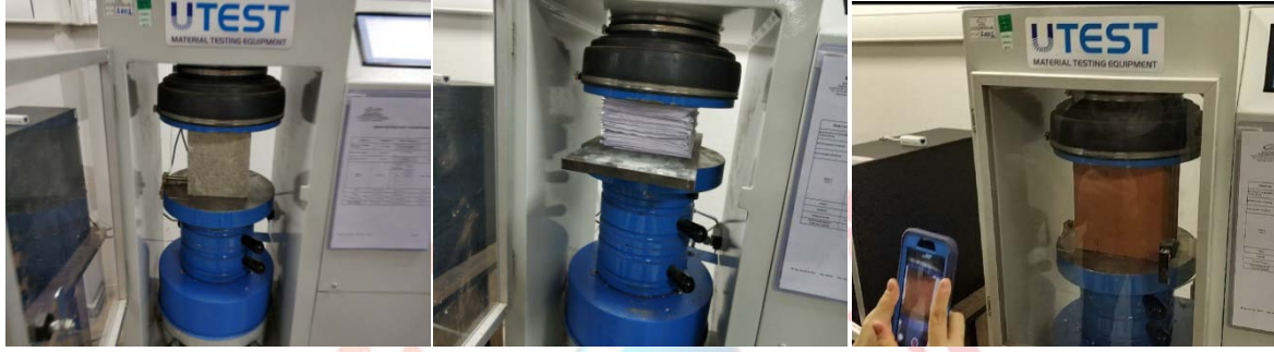
Şekil 4.1. Sırasıyla C50 beton, A5 kağıt ve tuğla basınç dayanım testi.

C50 beton numunesi, tuğla ve A5 kağıt ile yapılan testlere yönelik fotoğraflar Şekil 4.1'de verilmiştir.