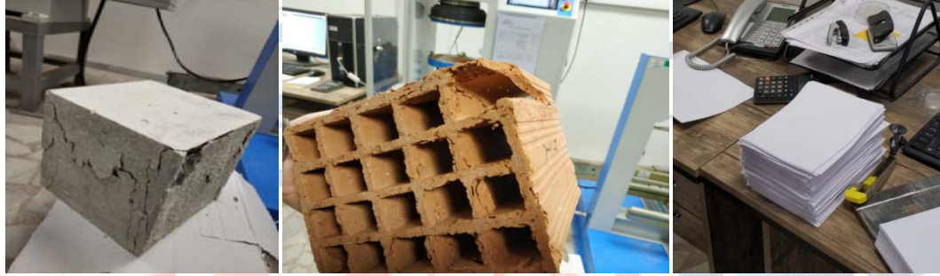
Şekil 4.2. Basınç dayanım testi sonrası malzemelerde meydana gelen deformasyon.

Yapılan testlerden sonra kullandığımız malzemelerde meydana gelen deformasyon Şekil 4.2'de gösterilmiştir.