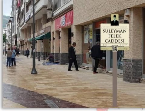
Şekil 7. Ordu Süleyman Felek Caddesine yerleştirilmesi düşünülen yenilikçi sokak tabelasının konumlandırılmasına ait görsel.

nin tarihinden kesitler sunabilmek adına karekod teknolojisiyle donatılan yeni sokak tabelaları Şekil 7’de görüldüğü üzere sokak ve caddelere yerleştirilerek insanların ilgisinin bu tabelalara yoğunlaşması sağlanabilir. Zaten tabela başında birkaç kişinin karekodu okuttuğunun görülmesiyle oluşacak merak duygusu insanların ilgisini bu tabelalara yöneltecek ve böylece projemiz amacına ulaşmış olacaktır. Gösterilen ilgi çalışmanın farklı illerde de uygulanması yönünde istek oluşturabilecektir.