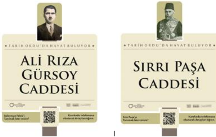
Şekil 6. Ali Rıza Gürsoy ve Sirri Paşa Caddeleri yeni nesil sokak tabelaları