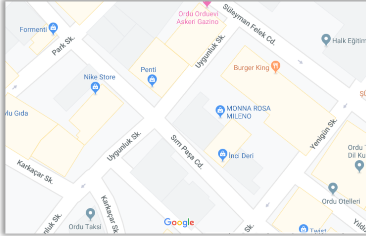
Şekil 1 .Ordu ili, Altınordu ilçesi Düz mahallege ait sokak haritası (Anonim 1)

Kentsel kimliğimizin önemli bir unsuru olan ve kültürel öğeler, tarih ve coğrafyadan köken alan sokak adlarımız ve taşıdıkları anlamlar kentlerin eski mahallelerine hapsolmakta, şehrin büyümesiyle ortaya çıkan yeni sokak ve caddeler için yapılan isimlendirmelerde sayılar tercih edilmektedir. Bu durum Ordu ili Altınordu ilçesi özelinde Şekil 1 ve Şekil 2'deki harita örneklerinde görülmektedir. Şekil 1 ile verilen harita Ordu'nun en eski mahallelerinden biri olan Düz Mahalle'ye ait sokak düzenini göstermektedir. Harita incelendiğinde Süleyman Felek, Sırrı Paşa, Park, Karkaçar, Uygunluk, Yenigün gibi sokak isimleri dikkat çekmektedir.