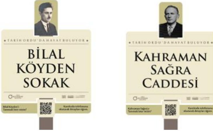
Şekil 5. Bilal Köyden Sokak ve Kahraman Sağra Caddesi yeni nesil sokak tabelaları

Ahmet Cemal Mağden: http://tabela.ordu.bel.tr/isim/buyuk-hayirsever-ahmet-cemal-magden