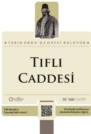
Şekil 3. Tıflı Caddesi için tasarlanan yeni nesil sokak tabelası

Şekil 3,4, 5ve 6 da Ordu Büyükşehir Belediyesi desteğiyle hazırladığımız yeni nesil karekodlu sokak tabelalarından örnekler görülmektedir. Tabelalardaki karekodlar cep telefonlarının kameralarıyla okutulduğunda, hazırlanmış olduğumuz bilgilendirme sayfasına ulaşmaktadır. Tabelaların küçültülmüş halleri rapora eklendiğinden karekodların okunamama ihtimaline karşı, karekodlarla ulaşılacak sayfaların linkleri tabelaların alt kısımlarına eklenmiştir.