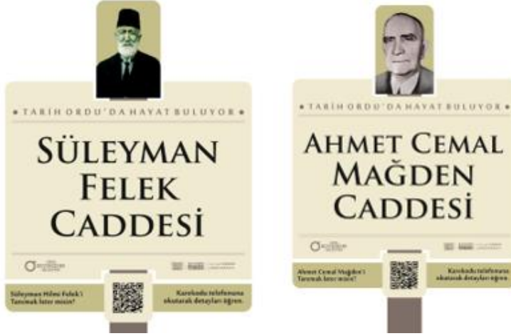
Şekil 4. Süleyman Felek ve Ahmet Cemal Mağden caddeleri yeni nesil sokak tabelası

Süleyman Felek: http://tabela.ordu.bel.tr/isim/ordu-belediyesi-reisi-suleyman-felek